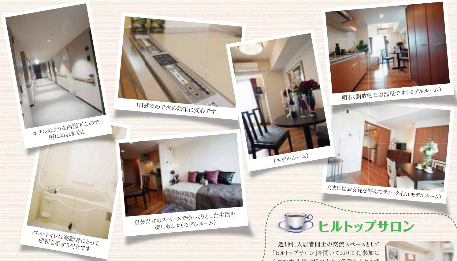
ホテルのような内廊下なので雨にぬれません